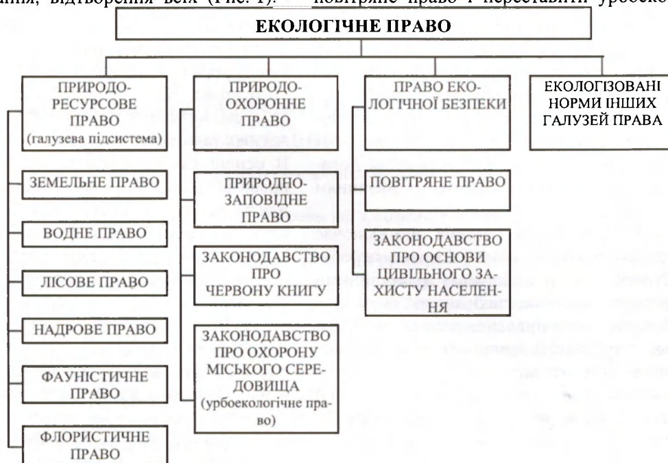
Рис. 1. Система комплексної субгалузі права “екологічне право”

нтуванням позиції про недоцільність виділення такого права у контексті визначення права. У зазначеній моделі структури природноресурсового права пропонується внести сегмент про повітряне право і переставити урбоекологічне